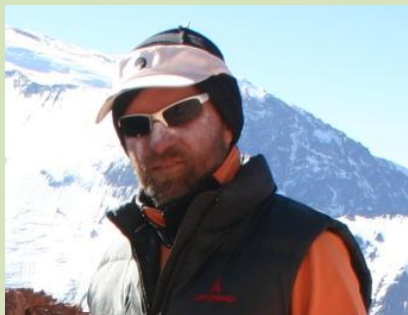
Rád by změnil myšlení lidí

6 - 7 | 2012 | bulletin asociace Přátelé přírody ČR | www.pratele-prirody.cz | zdarma