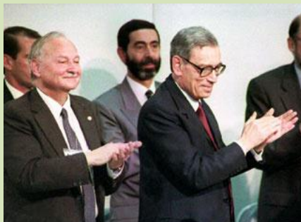
Vzpomínka na Summit Země