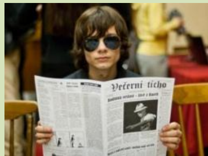
Večerní ticho znělo Prahou