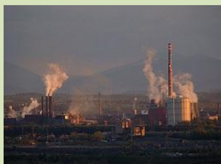
Smog zdarma i nadále?

5 | 2012 | bulletin asociace Přátelé přírody ČR | www.pratele-prirody.cz | zdarma