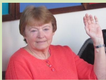
Strašně aktivní Jablonečáci