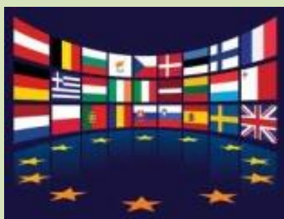
Jarní dopis z Bruselu