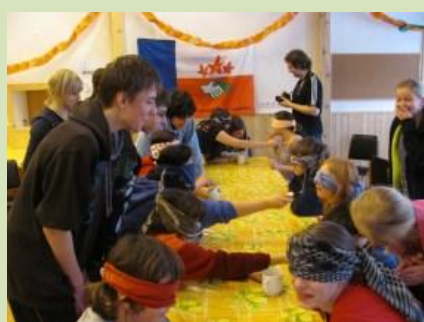
Move It: Projekt pro mládež

3 | 2012 | bulletin asociace Přátelé přírody ČR | www.pratele-prirody.cz | zdarma