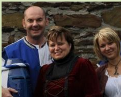
Rozhovor s fandou středověku