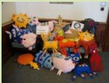
Vánoční dárek pro nevidomé