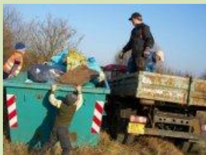
V Olomouci bude nový les

1 | 2012 | bulletin asociace Přátelé přírody ČR | www.pratele-prirody.cz | zdarma