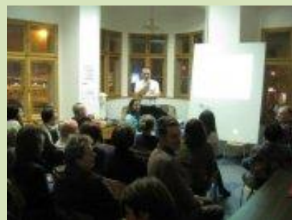
Na skok do Tibetu pomáhat